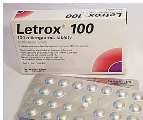
Letrox®, hromadně vyráběný léčivý přípravek s levothyroxinem