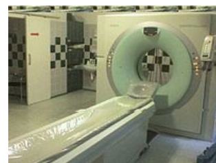
Počítačový (výpočetní) tomograf