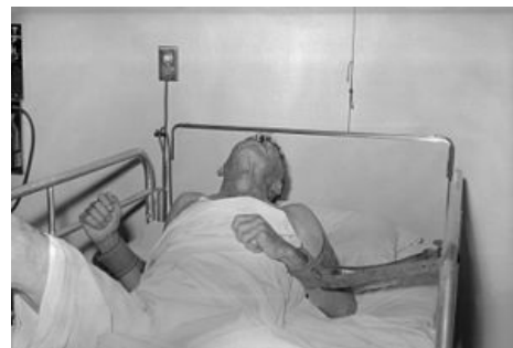
Pacient se vzteklinou