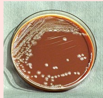
Yersinia pestis na krevním agaru