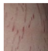
Strie z tohoto těhotenství