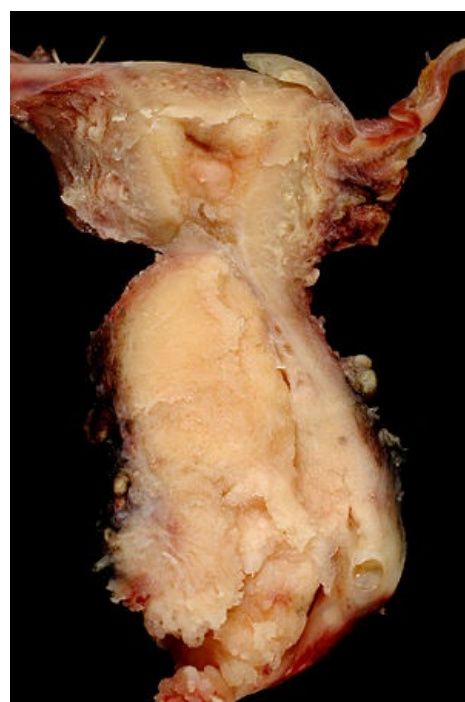
Spinocelulární karcinom děložního hrdla