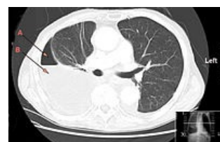
CT snímek hrudníku s hemopneumothoraxem: A- plyn, B- kapalina

Často dochází k poranění plíce a vzniku pneumothoraxu nebo hemothoraxu. Při poranění tzv. sleziných žeber (9.–11. žebro vlevo) dochází často k poranění sleziny s rizikem vzniku hemoperitonea.