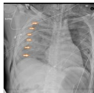
Sériová fraktura žeber na RTG

K léčbě zlomenin žeber přistupuje hlavně konzervativně . Většinou formou bandáže nebo jiné fixace hrudníku. Doporučuje se poloha nemocného v polosedě (Fowlerova poloha), která usnadňuje dýchání. Zlomeniny žeber jsou velice bolestivé, proto se doporučuje analgetická léčba (opiáty, Codein), případně obstřík mezižebních nervů (lokální anestezie). Při výrazné cyanóze pacienta nebo zlomenině více než 5 žeber přistupujeme k umělé plicní ventilaci. Operační řešení za použití malých dlah volíme pouze u nestabilních hrudníků. Zlomeniny žeber se hojí přibližně 3–6 týdnů. Na RTG snímcích můžeme vidět ztlustění v oblasti původní zlomeniny, které je obrazem tvořícího se svalu. V době rekonvalescence se doporučuje dechové cvičení po poučení rehabilitačními pracovníky.